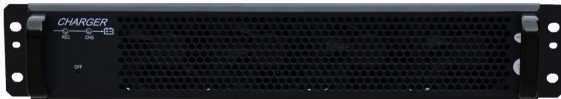
МОДУЛЬ ЗАРЯДНОГО УСТРОЙСТВА (24А)